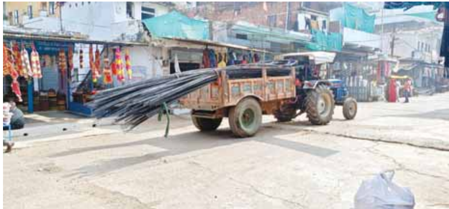
हरिभूमि न्यूज ▶▶ तैदूखेड़ा

कृषि कार्य के लिए खरीदे जाने वाले ट्रैक्टर-ट्राली का व्यवसायिक उपयोग करते हुए असुरक्षित तरीके से निर्माण सामग्री जैसे लोहे की छड़े, रेत गिट्टी, मुम आदि की ढुलाई की जा रही है। ट्राली से लोहे की राडे 4 फीट तक बाहर निकली रहती है, जिससे पीछे से आने वाले वाहन चालकों के साथ हादसा होने का अंदेशा बना रहता है। जबकि ट्रैक्टर का उपयोग कृषि कार्य में होने के कारण आरटीओ से टैक्स में राहत मिलती है। जिसका लाभ उठाते हुए व्यवसायिक उपयोग कर निर्माण सामग्री को ढोने में उपयोग किया जा रहा है। सबसे अधिक खनिज सामग्री ढोने का काम हो रहा है। रात में मार्ग पर चलते वाहनों में कई कमियां होने के कारण खतरा बना